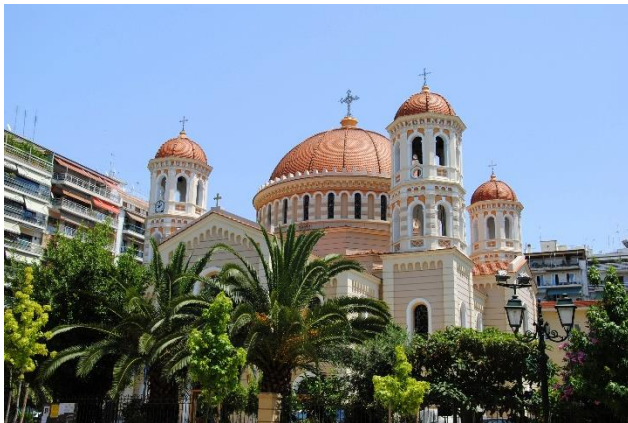
Pierwsze zdjęcie: cerkiew pw św. Grzegorza Palamasa w Grecji.

Na każdej kopule umieszczony jest krzyż, co oznacza, że cerkiew oddaje chwałę Jezusowi Chrystusowi.